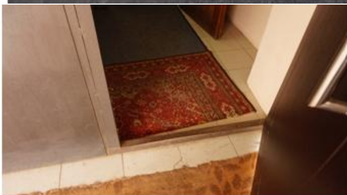
Фото № 4: Пути движения внутри здания